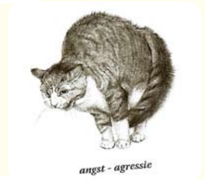
angst - agressie